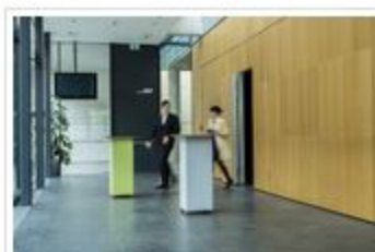
Der RELAX Table von Nina Mair für YDOL ist ein akustisch wirksames Möbel.

Nina Mair hat es wieder gemacht und geschafft. Die kreative Designerin entwarf mit dem RELAX Table für YDOL nicht nur einen formschönen Stehtisch, der die RELAX Kollektion ergänzt, sondern begründete damit sogleich eine weltweit neue Produktkategorie. Gleich zwei Funktionen werden dabei diesem Möbel vereint, der unter dem Titel SILENT FURNITURE von dem deutschen Label, das zu den führenden Unternehmen im Bereich akustischer Innenraumgestaltung zählt, lanciert wurde.