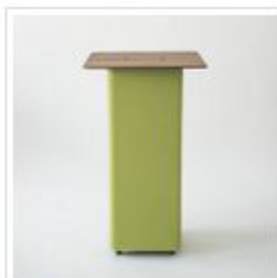
Die schicke Tischplatte tappt das Möbel. Auf Wunsch kann ein „Power“-Fach integriert werden.