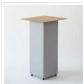
Der Stehtisch punktet mit seinem Look und sorgt für optimale Akustik.

Hier verbirgt sich denn auch noch ein weiteres Special. So kann optional in die Tischplatte ein Fach integriert werden, in dem sich ein GIRA Energieversorgungssystem versteckt, das Ladegeräte verschiedener mobiler Geräte aufnehmen und unter der bündig abschließenden Klappe kurzerhand im RELAX Table „verschwinden“ lassen kann.