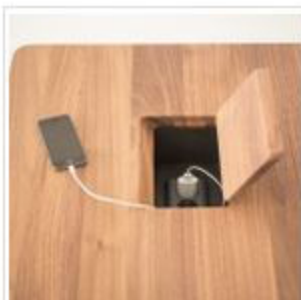
Mit der integrierten „Power“-Option können Ladegeräte mobiler Geräte versteckt werden.