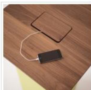
Unter einer Klappe verbirgt sich ein Energieversorgungssystem.