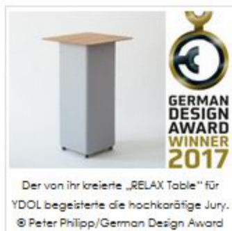
Der von ihr kreierte „RELAX Table“ für YDOL begeisterte die hochkarätige Jury.